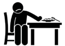
Pérdida de Apetito