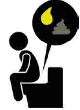
Orina oscura, heces blancas, y diarrea

Si usted cree que tiene hepatitis A debido a estos síntomas, consulte a su médico o visite la sala de emergencias más cercana. Siempre lávese las manos con agua y jabón después de usar el baño y antes de preparar la comida.